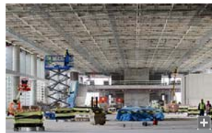
Vista interior de las obras de la nueva terminal.

El "Plan Málaga" para ampliar el aeropuerto de esta ciudad ha invertido ya el setenta por ciento de los 1.400 millones de euros previstos y una de sus principales actuaciones, la construcción de una nueva terminal, tiene ya su obra civil ejecutada en un 85 por ciento y se terminará en el primer semestre de 2009.